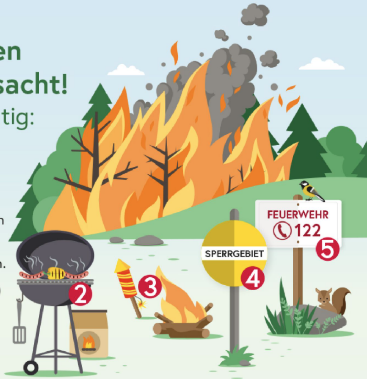
ILLUSTRATION: © BMLUK/ZENZ